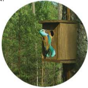
Здымак атрыманы з аўтаматычнай камеры, усталяванай пры падтрымцы Ruffed Small Grant

Сяброў АПБ і захавальнікаў ТВП чакае не менш насычаная восень. Сачыце за абвесткамі і далучайцеся да нашых мерапрыемстваў. Разам для прыроды і людзей!